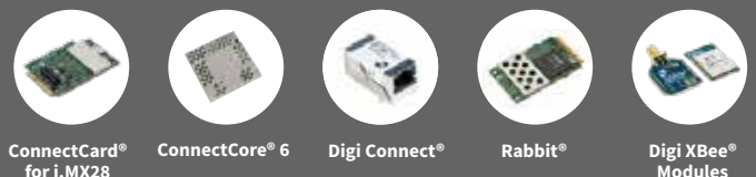
ConnectCard® for i.MX28