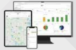
Digi Remote Managerで デバイスを管理